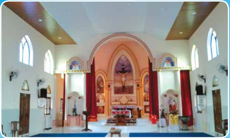
Sacred Heart Church Hossur (Induvally) Consecrated on 25-04-2016