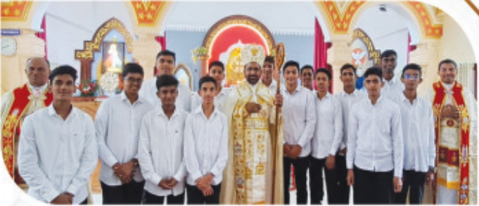
മൈനർ സെമിനാരിയിലെ ഒന്നാം വർഷ വൈദിക വിദ്യാർത്ഥികൾ അഭിവന്ദ്യ പിതാവിനോടൊപ്പം