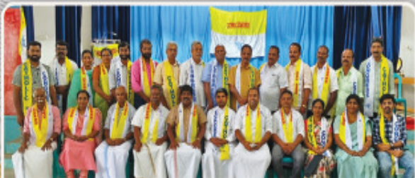
ഇടുക്കി രൂപതാ കത്തോലിക്കാ കോൺഗ്രസിന്റെ പുതിയ ഭാരവാഹികൾ