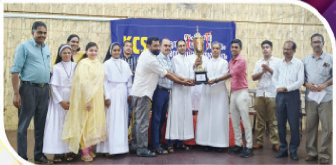
2022 - 23 പ്രവർത്തനവർഷത്തിലെ കെ.സി.എസ്.എൽ സംസ്ഥാനതല മികച്ച രൂപതയ്ക്കുള്ള ട്രോഫി ഏറ്റെടുത്തു.