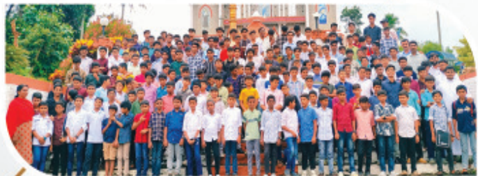
ഇടുക്കി രൂപതാ അൾത്താര ബാലസംഗമം