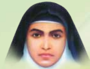
The Diocese of Bhadravathi