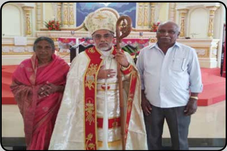
GOLDEN JUBILEE OF WEDDING ANNIVERSARY