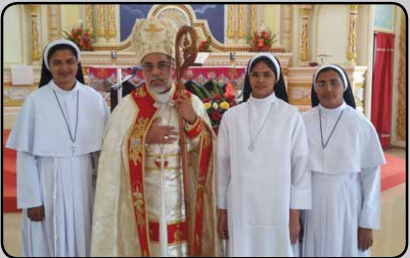
SILVER JUBILEE OF RELIGIOUS PROFESSION