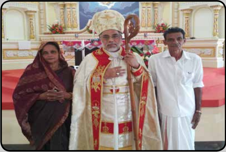
GOLDEN JUBILEE OF WEDDING ANNIVERSARY