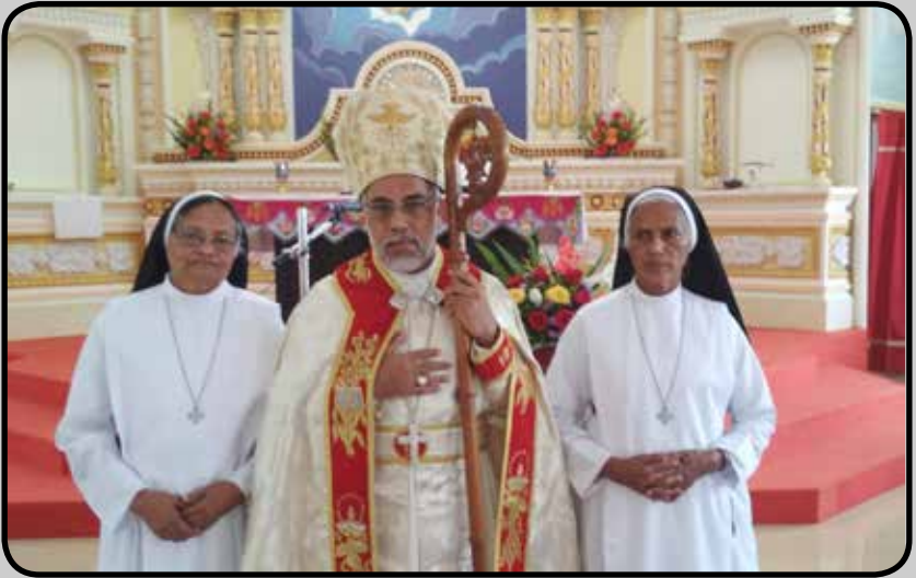
GOLDEN JUBILEE OF RELIGIOUS PROFESSION