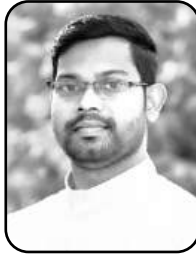
— फा. दिपक